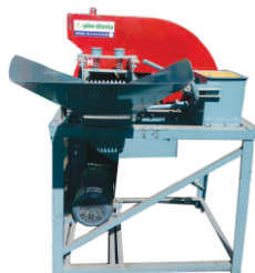
3 HP Model