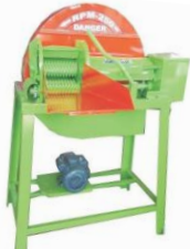
3 HP Model