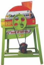
2 HP Model